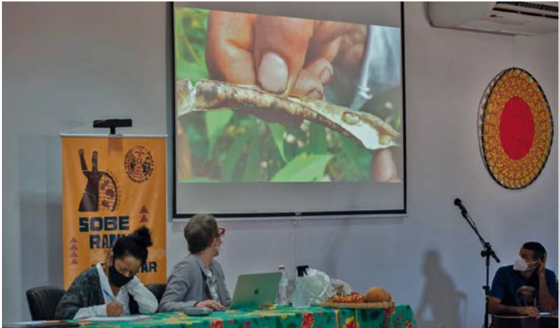
Apresentação do caso do Quilombo Guerreiro durante Audiência Final do TPP, em julho de 2022.